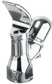
Bateria samozamykająca do źródeł wody pitnej