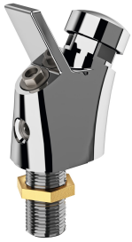
ANIMA Bateria do źródła wody pitnej