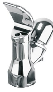
Bateria samozamykająca do źródeł wody pitnej