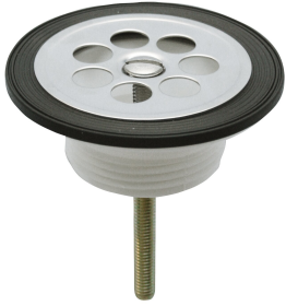
Zawór odpływowy z sitkiem